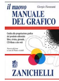
G. Fioravanti Il manuale del grafico Zanichelli 2002