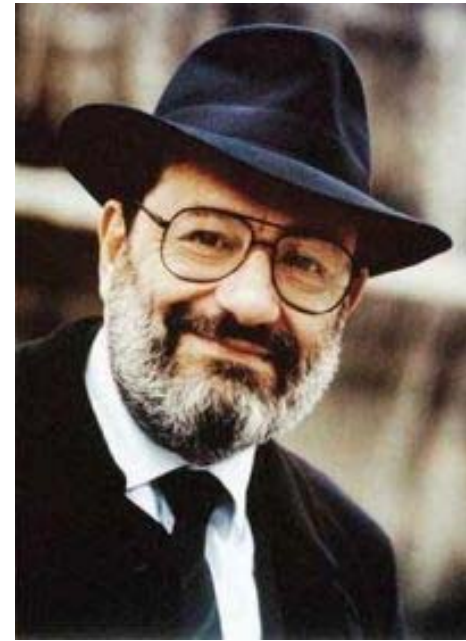
Semiotica interpretativa (Umberto Eco)

Questo corso riguarderà soprattutto la semiotica interpretativa di Umberto Eco